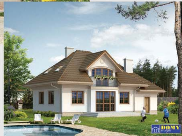
Autor: arch. Tomasz Sobieszuk, arch. Piotr Rynkiewicz