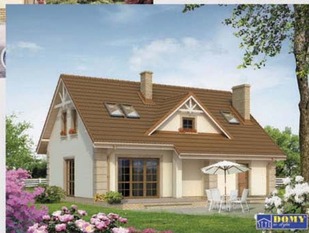
Autor: arch. Tomasz Sobieszuk, arch. Elżbieta Wysocka