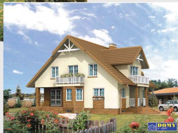
Autor: arch. Maciej Matłowski, arch. Tomasz Sobieszuk